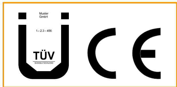
Abb. 8.1: Beispiele für ein Ü-Zeichen und ein CE-Zeichen

Die Gestaltung und Anbringung des Ü-Zeichens ist in der Übereinstimmungszeichen-Verordnung (ÜZVO /8-29/) desjenigen Landes geregelt, in dem der Hersteller seinen Sitz hat. Das Ü-Zeichen muss die Daten des Herstellers, die Prüfgrundlage (bei Norm-