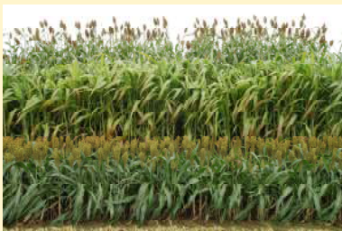
Gegenüberstellung von Körnersorghum (vorne), photoperiode-sensitivem (pps) Futtersorghum (Mitte) und konventionellem Futtersorghum (hinten).