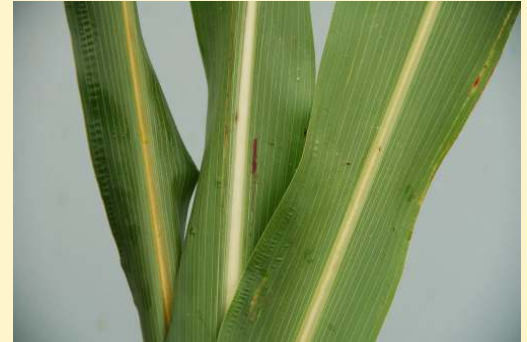
Unterschiedliche Ausprägungen der Blattmittelrippe bei Sorghumhirsen (von links nach rechts: brown-midrib, dry-midrib, juicy-midrib)