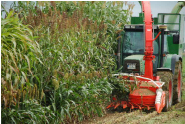
Abbildung 2: Morphologisch zeichnet sich Sorghum durch eine bemerkenswerte Vielfalt aus

graphischen Herkunft korrelieren, wird mitunter noch in der Pflanzenzüchtung gebraucht. Für praktische Belange erscheint es sinnvoll, die Sorten von S. bicolor nach deren Hauptnutzungsrichtung und dementsprechend ihrem Gesamthabitus in den Körnertyp, den Futtertyp und den Dualtyp einzuteilen. Zahlreiche weitere wirtschaftlich relevante Sorghumarten sind das Ergebnis einer natürlichen oder züchterischen interspezifischen Hybridisierung. So ist die Art S. sudanense oder das echte Sudangras (Synonym: S. x drummondii ) ein natürliches Kreuzungsprodukt von S. bicolor und S. arundinaceum . Die interspezifischen Zuchthybriden von S. bicolor und S.