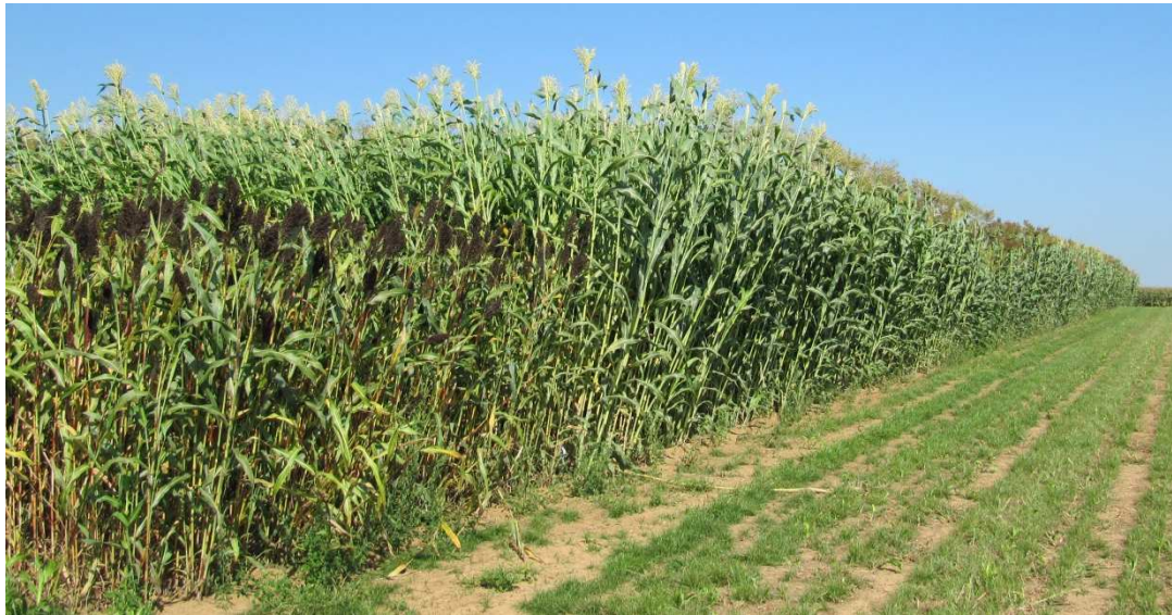
Abbildung 1: Blick entlang des Sorghum-Screenings, vorne links S. nigricans

Das bekannte Sorghum-Sortenscreening des TFZ umfasste in 2017 insgesamt 49 Sorten und Linien. Die Anbausaison 2017 war sehr günstig für Sorghum, der Sommer bot mit warmer Witterung und vielen Sonnenstunden beste Bedingungen für die Massebildung.