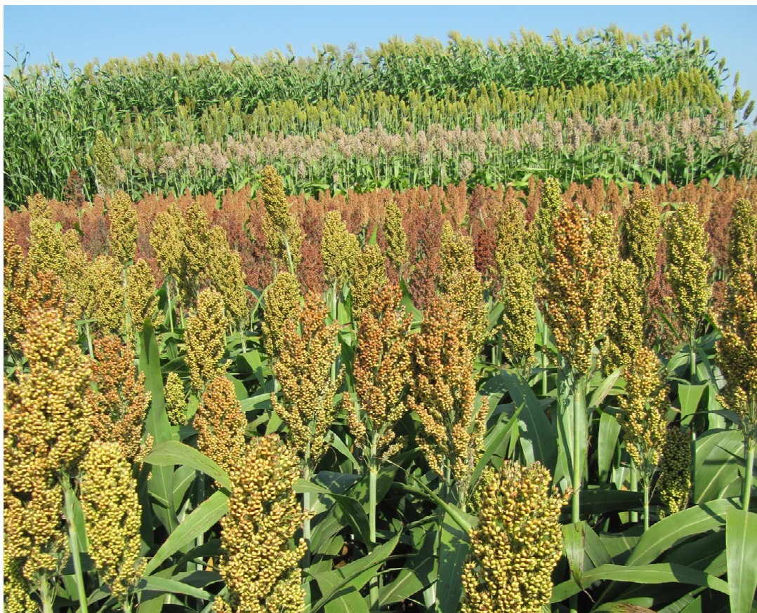
Abbildung 3: Blick über die erste Wiederholung des Körnersorghum-Screenings, im Hintergrund ein weiterer Sorghumversuch

Aufgrund der sehr günstigen Bedingungen standen die spätreifenden Maissorten sogar etwas kürzer im Feld als die frühreifenden Sorten. Der Referenzmais erzielte mit 201,5 bis 243,8 dt/ha sehr gute TM-Erträge, wobei Sorte Barros unerklärlicherweise etwas hinter den Erwartungen zurückblieb.