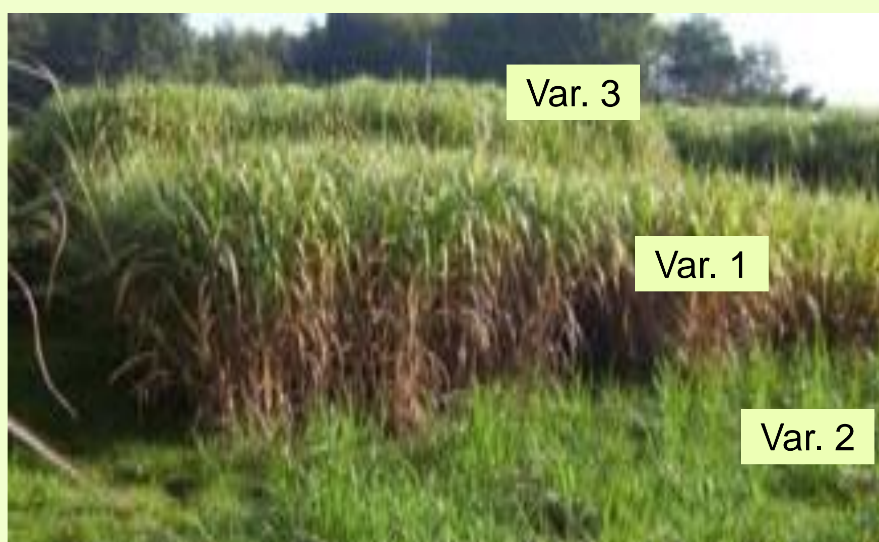
Abb. 2: Die drei Miscanthus x giganteus Versuchsvarianten am 01.10.2007