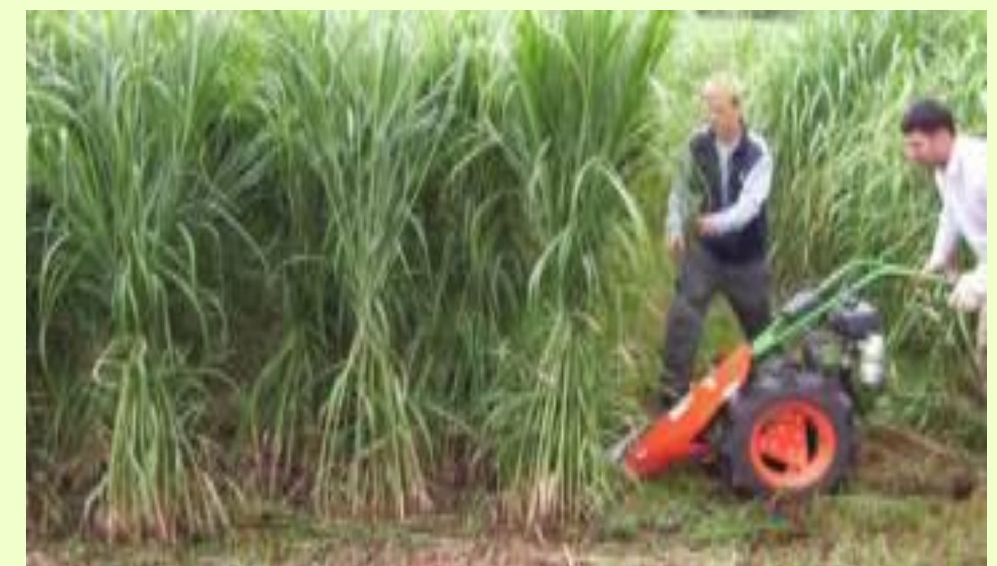
Abb. 1: Sommerschnitt 2006