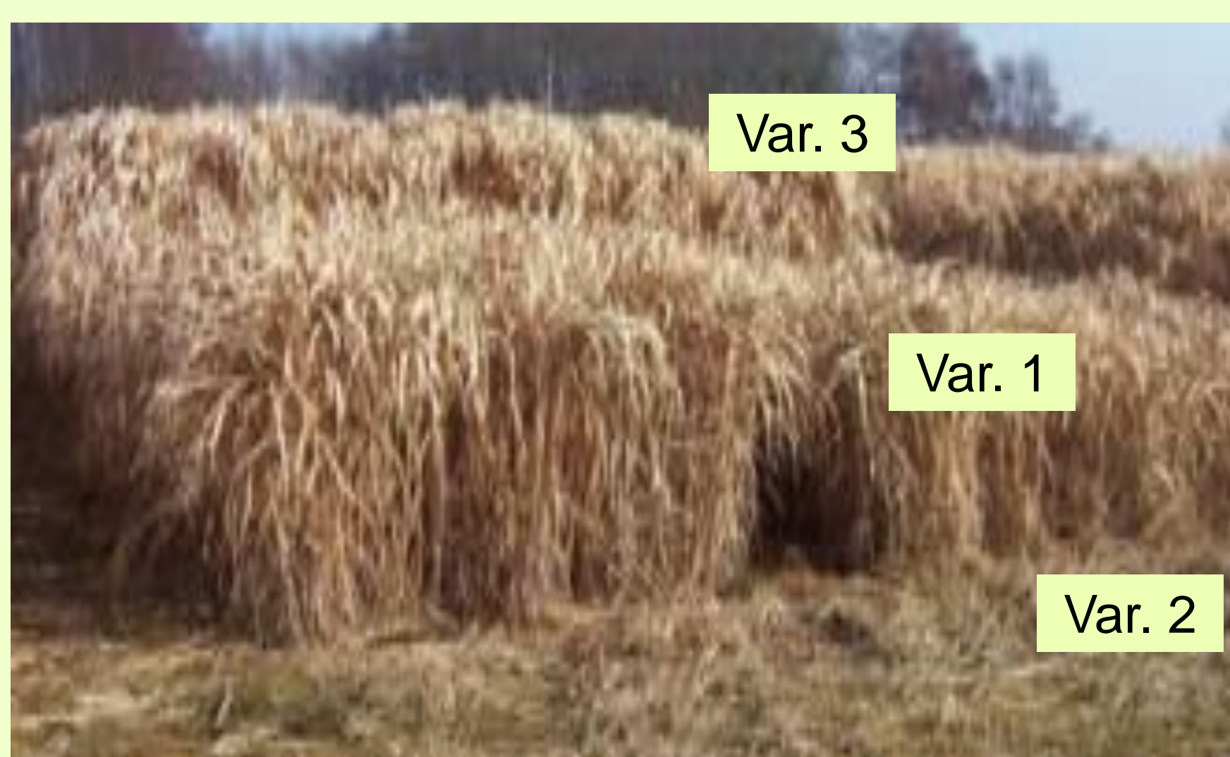
Abb. 3: Die drei Miscanthus x giganteus Versuchsvarianten am 10.03.2008

Die Varianten 1 und 2 erreichten nach dem Sommerschnitt 2006 im Herbst nur geringere Wuchshöhen als Var. 3 (Kontrolle). Nach dem zweiten Sommerschnitt 2007 erlangte Var. 2 im Juni 2008 nicht einmal 1 m Höhe, während Var. 1 nur 38 cm kleiner blieb als Var. 3.